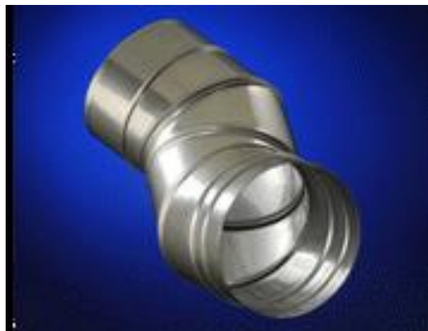
Fig. 1 Schiedel Prima Plus.

Schiedel Prima Plus tilfredsstillter kravene i henhold til NS-EN 1856-2:2009.